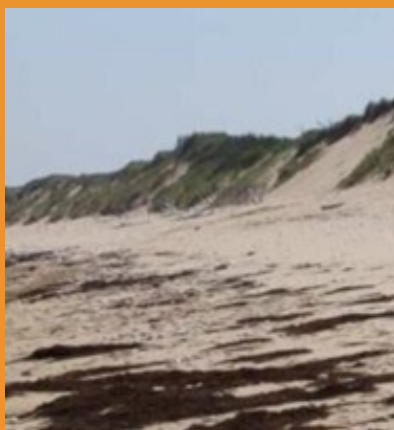
PIED DE DUNE