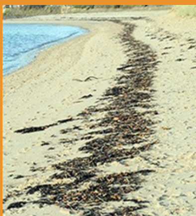
LAISSE DE MER